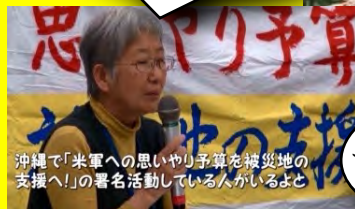
沖縄で「米軍への思いやり予算を被災地の支援へ!」の署名活動している人がいるよと