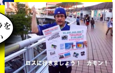
ロスに行きましょう! カモン!