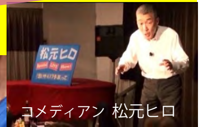
コメディアン 松元ヒロ