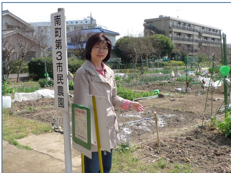
市内の農園を見学

今年から始まる府中市の第3次農業振興計画では、「市民とともに」の思いが強く謳われています。①次世代を担う子どもたちへの農地・農業を活用した事業の推進、②市民農業大学、ふれあい体験講座や農業収穫体験、③援農ボランティア制度をすすめ、ふれあいの場をつくることで農業への理解を広める、など地域コミュニティの活性化につながる計画です。農地を持たない人が、農地が減っていくのをただ見てい